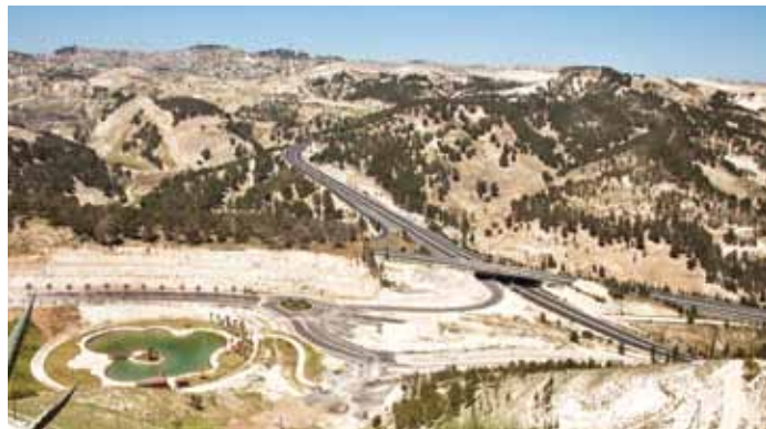
▲ Une colonie israélienne en bordure de Jérusalem Est. Les colonies sont érigées autour de la ville, coupant effectivement la partie palestinienne de Jérusalem Est de la Cisjordanie. Alors que les communautés palestiniennes subissent d'importantes pénuries d'eau, beaucoup des résidences dans les colonies ont des piscines et autres facilités.

L'accès à Jérusalem-Est reste également un problème majeur. Israël oblige en effet tout Palestinien qui ne dispose pas d'un droit de résidence à Jérusalem ou de la nationalité israélienne à demander un permis par un processus compliqué et chronophage. C'est également le cas des malades devant accéder aux hôpitaux palestiniens de Jérusalem-Est. En 2011, 19 % des patients et de leurs compagnons de Cisjordanie qui ont demandé à bénéficier d'un accès aux soins de santé se sont vu refuser leur permis, ou bien l'octroi de celui-ci a été retardé. 33 Pour la grande majorité des déplacements par ambulance, les patients doivent être transférés d'une ambulance palestinienne dans une ambulance israélienne à un poste de contrôle avant d'entrer dans Jérusalem. 34