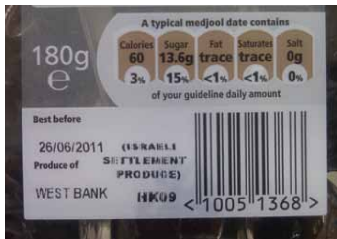
▲ L'étiquetage de ces dates, vendues au Royaume-Uni, indique clairement qu'elles sont 'un produit des colonies israéliennes' en Cisjordanie.

Le ministre danois des Affaires étrangères Villy Søvndal annonçant l'entrée en vigueur des directives sur l'étiquetage. 147