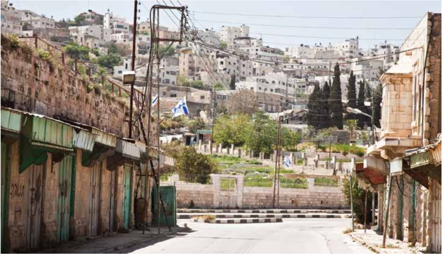
▲ À Hébron, les Palestiniens ont déserté les rues à cause de la présence des colons dans le centre ville. Cette rue, comme beaucoup d'autres, vibrait autrefois au rythme du marché. Aujourd'hui, elle est vide.