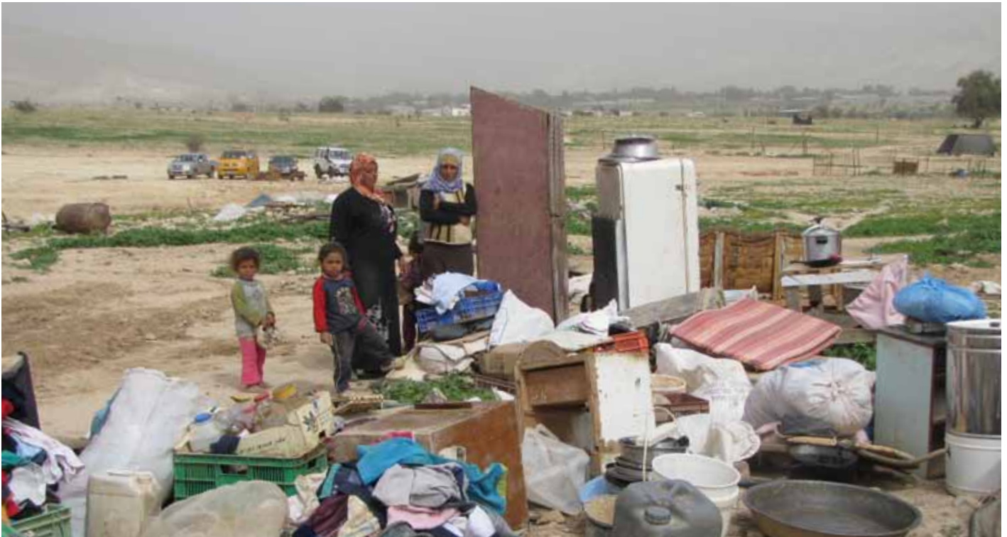
▲ A Fasayil dans la Vallée du Jourdain, les membres de la famille a-Rashaydah contemplant ce qu'il reste de leur maison détruite.

La politique israélienne de construction de colonies sur les territoires occupés entraîne des atteintes généralisées aux droits humains et nuit au développement des communautés palestiniennes. Des habitations palestiniennes sont démolies pour faire place à des colonies illégales, ce soldant chaque année par le déplacement de centaines de personnes. Les colonies privent les Palestiniens de leur liberté de circulation et d'un accès à des ressources vitales comme l'eau et les terres agricoles.