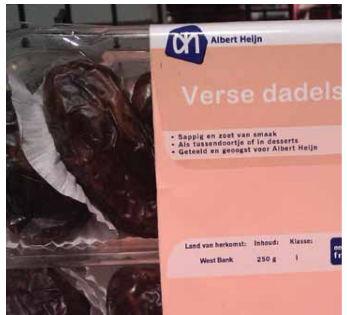
▲ Dans un supermarché aux Pays-Bas, cet étiquetage de dates indique leur provenance comme étant 'de Cisjordanie', laissant le consommateur dans le flou quant à leur origine exacte – est-ce des colonies israéliennes ou des producteurs palestiniens ? Une enquête auprès du distributeur a démontré qu'elles proviennent de la colonie israélienne de Tomer, dans la Vallée du Jourdain.

Le principal exportateur israélien de dattes est l'entreprise Hadiklaim. Toutes les dattes de Hadiklaim semblent porter la mention « Produit d'Israël », ce qui fait que le consommateur a du mal à établir une distinction entre les dattes en provenance d'Israël proprement dit et de la vallée occupée du Jourdain.