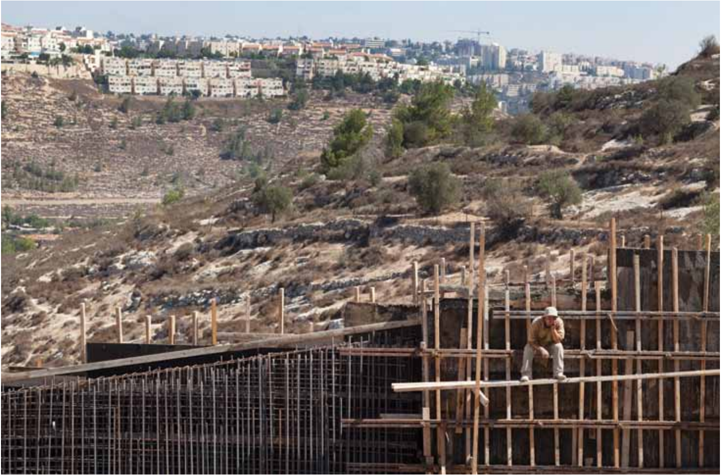
▲ Construction du Mur dans le village palestinien d'Al Walaje. Le village est entouré de milliers de blocs résidentiels appartenant aux colons (bloc de Gush Etzion).