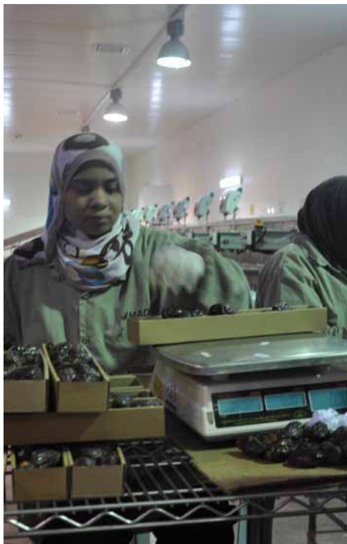
▲ Des ouvrières trient des dattes destinées à l'exportation à l'usine de Nakheel Palestine for Agricultural Development.

L'objectif étant d'offrir une alternative intéressante à l'emploi dans les exploitations agricoles des colonies, Nakheel Palestine emploie à l'heure actuelle 40 ouvriers à temps plein et 100 saisonniers. Al-Manasreh prévoit de planter 24 000 dattiers supplémentaires au cours des deux prochaines années, et ainsi de tripler ses effectifs.