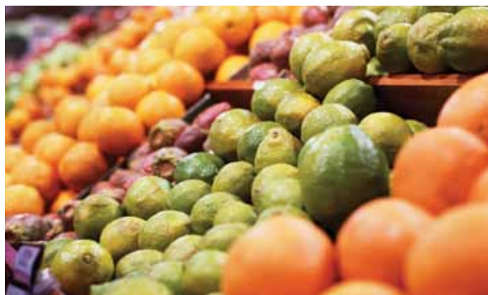
▲ Des agrumes dans un supermarché

Outre les produits frais, plusieurs vins israéliens vendus en Europe sont fabriqués avec du raisin cultivé dans les colonies. D'après l'ONG israélienne Who Profits, tous les principaux établissements vinicoles israéliens qui exportent vers l'Europe possèdent des vignobles dans le plateau du Golan occupé et la plupart également en Cisjordanie. 106 Parmi les entreprises de transformation de denrées alimentaires basées en Cisjordanie qui exportent vers l'Europe figurent Achdut (fabricant du halva Achva) et Adanim Tea (tisanes). 107