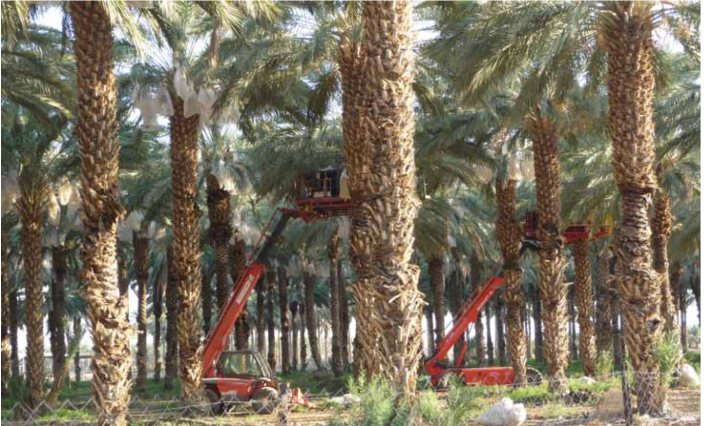
▲ Des Palestiniens récoltent des dates dans la colonie de Tomer, Vallée du Jourdain. Les accidents de travail sont fréquents, mais dans la plupart des cas, les travailleurs Palestiniens ne sont pas couverts par leurs employeurs des colonies.