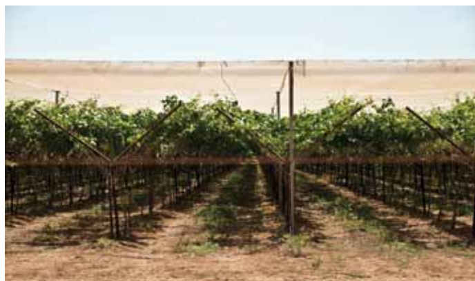
▲ Ces vignes, qui font partie d'une colonie israélienne illégale dans la Vallée du Jourdain en Cisjordanie, ont été plantées sur des terres palestiniennes confisquées.

D'après l'ONG israélienne Peace Now, le gouvernement israélien consacre chaque année au moins 1,6 milliard de shekels (330 millions €) de plus aux avantages destinés aux colons qu'à ceux destinés aux citoyens vivant au sein d'Israël proprement dit. Ce chiffre ne comprend pas les importants fonds de sécurité consacrés aux colonies. Les subventions gouvernementales destinées aux autorités locales des colonies représentaient plus du double par habitant de celles allouées aux personnes vivant au sein d'Israël, tandis que les dépenses d'éducation par élève étaient 63 % plus élevées dans les colonies. 75