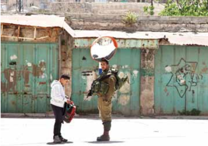
▲ Un soldat Israélien fouille le sac d'école d'un garçon à Hébron. La famille du garçon est une des dernières familles palestiniennes vivant encore dans la vieille ville au coeur d'Hébron. Les Palestiniens qui n'habitent pas la vieille ville ne sont pas autorisés à emprunter certaines routes d'accès.

Les colonies sont des communautés israéliennes établies sur le territoire occupé par Israël depuis la guerre israélo-arabe de 1967. Elles sont soutenues par une infrastructure comprenant des routes spéciales, des postes de contrôle et une barrière de séparation qui les dissocie de la population palestinienne voisine. Les colonies portent atteinte au droit international et aux résolutions du Conseil de sécurité de l'ONU et, pourtant, depuis 45 ans qu'Israël occupe le territoire palestinien, chaque gouvernement israélien a encouragé une expansion continue des colonies.