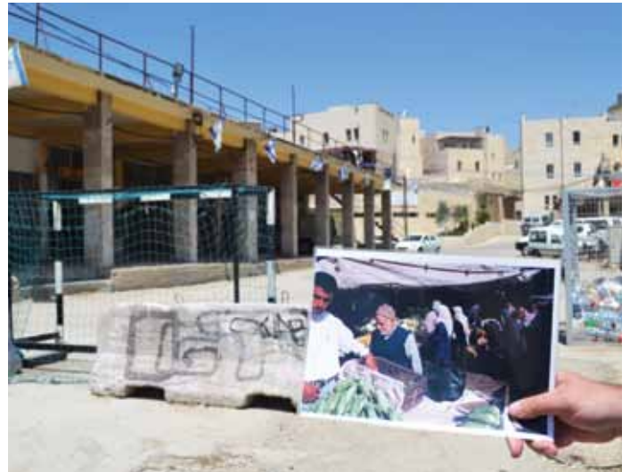
▲ Une photo juxtapose la rue commerçante d'Hébron telle qu'elle était en 1999, et ce qu'elle est devenue aujourd'hui. Depuis que son centre historique est fermé aux Palestiniens, Hébron est une ville fantôme.