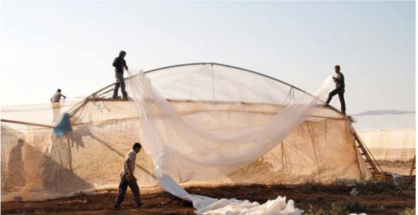
▲ Des Palestiniens construisent une serre sur une ferme de colons israéliens dans la Vallée du Jourdain.

Les citernes d'eau utilisées par les agriculteurs palestiniens pour collecter l'eau de pluie sont souvent démolies par les autorités israéliennes (46 ne serait-ce que pour l'année 2011), ce qui limite encore davantage leur capacité à produire diverses cultures. 43 En outre, ces dernières années, les colons se sont emparés d'un nombre croissant de sources d'eau situées sur les terres palestiniennes à proximité des colonies, ces colons empêchant ensuite les Palestiniens d'y accéder. 44