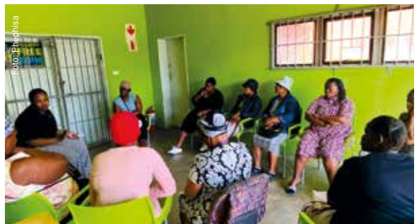
La Red de Supervivientes Phephisa empodera a las supervivientes de la violencia sexual y de género en Sudáfrica.