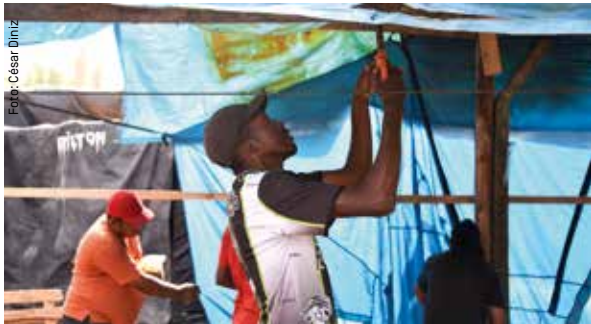
El movimiento de trabajadores sin techo MTST lucha por el derecho a la vivienda en Brasil.