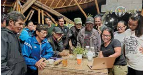
El Instituto Mosintuwu de Indonesia apoya la resistencia contra los proyectos destructivos a gran escala.