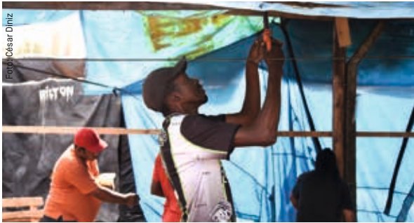
Le mouvement des travailleurs sans domicile fixe (MTST) lutte pour le droit au logement au Brésil.