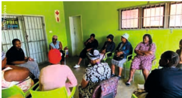
Le Phephisa Survivors Network renforce les survivants de la violence sexualisée et sexiste en Afrique du Sud.